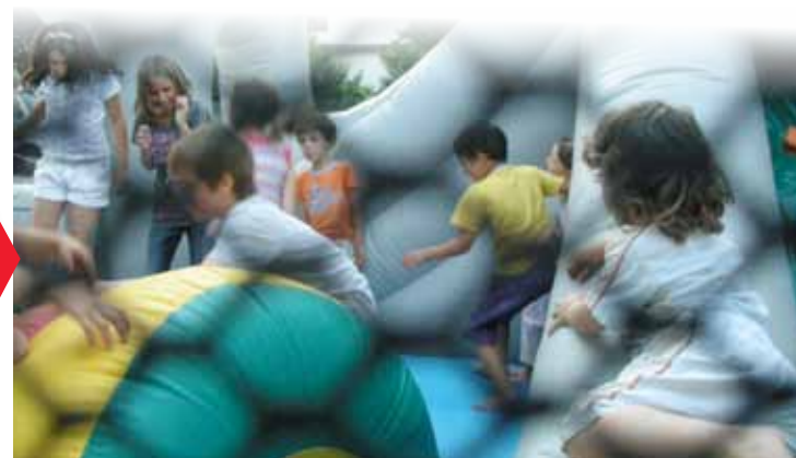
IL RICAIVATO VERRÀ DEVOLUTO IN OPERE DI BENEFICENZA

UN GONFIABILE SARÀ A DISPOSIZIONE DEI BAMBINI FINO A 10 ANNI, ACCOMPAGNATI DAI GENITORI: MEGADIVERTIMENTO!