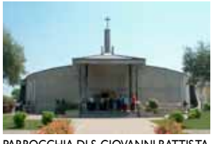
PARROCCHIA DI S. GIOVANNI BATTISTA