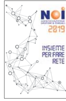
CIRCOLO G. LONGHIN

SAGRA DI SAN GIOVANNI BATTISTA dal 21 al 24 giugno e dal 28 al 29 giugno